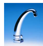
AUM3E Art.Nr. 66173