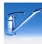
EKM Art.Nr. 04220