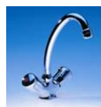
SNM Art.Nr. 04200