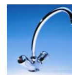
SKM Art.Nr. 04210