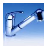
EKA Art.Nr. 04230